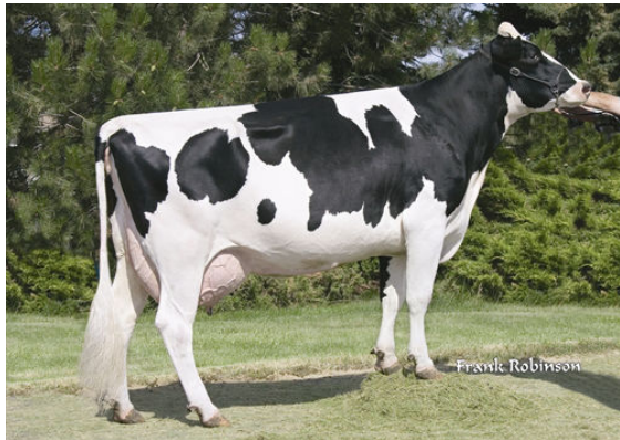
SEAGULL-BAY OMAN MIRROR Dam